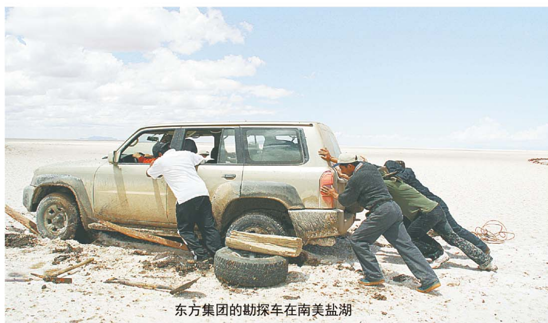
东方集团的勘探车在南美盐湖

阿根廷 东方集团正在对阿根廷一家盐湖锂公司项目进行考察和商务谈判。该项目是世界上已探明的第三大盐湖锂资源，位于世界“锂三角”区，方圆200公里内有世界三大盐湖锂生产商SQM、Chemetall和FMC的盐湖厂。我司已完成对该项目的经济价值评估和初步商务接洽，下一步将展开尽职调查和探讨深入合作的可能性。与此同时，我司与阿根廷驻华使馆、阿根廷相关政府部门保持了良好关系，力求多渠道、广泛地获得项目信息，在阿根廷本土寻找勘探机会。