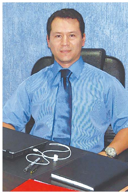
罗德在东方集团南美办公室

我希望我们东方集团在玻利维亚的工作人员一天天变多，某一天我们的办公室能变成一大座楼，我们现有的几个合作伙伴能变成无数的合作伙伴。我们现在就是玻利维亚一个办事处，但我希望有一天我们在每个拉美国家都有办事处，使东方集团的名声