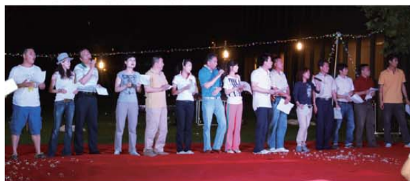
刚韧队合唱《明天会更好》