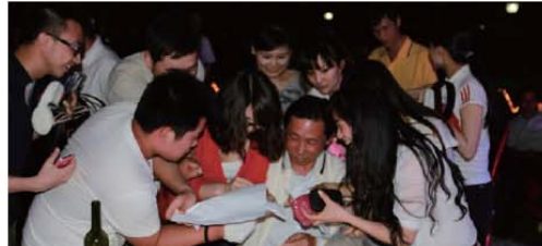
得到张总签名加10分 众人围拢张总争签名