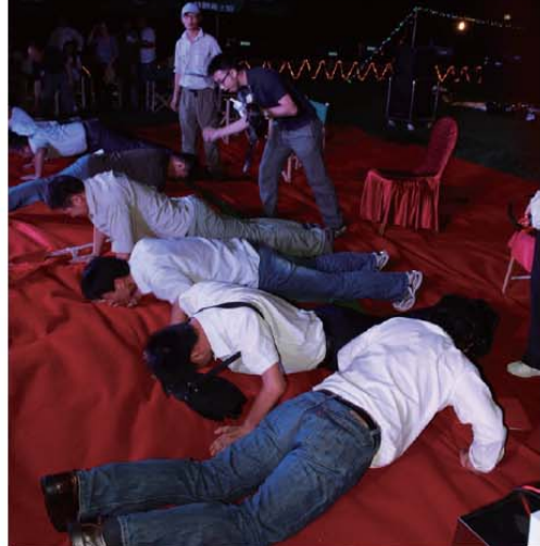
各队男士们奋力完成每人五十个俯卧撑