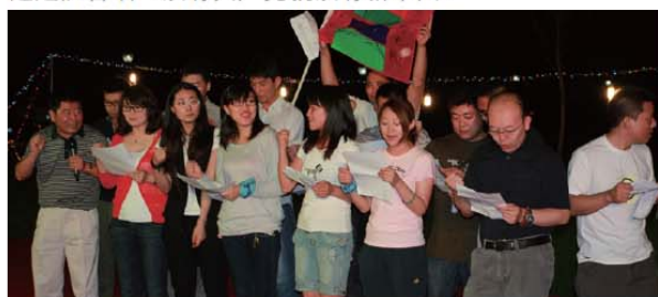
无畏队合唱《咱们工人有力量》