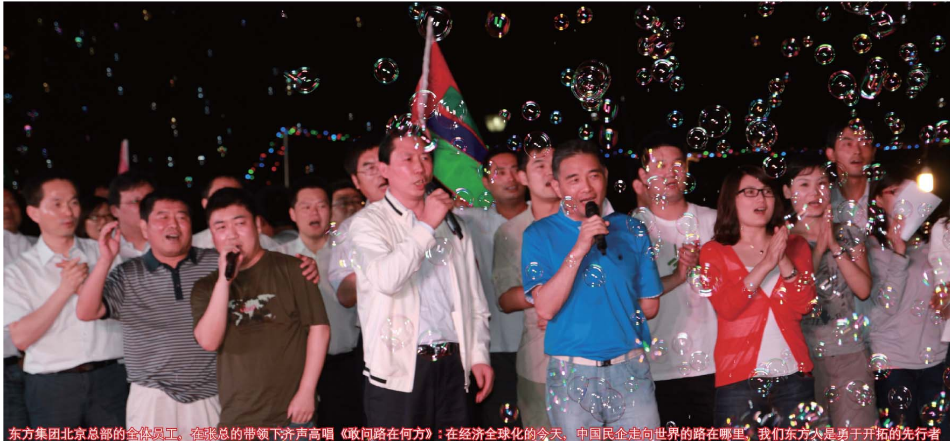
东方集团北京总部的全体员工，在张总的带领下齐声高唱《敢问路在何方》：在经济全球化的今天，中国民企走向世界的路在哪里，我们东方人是勇于开拓的先行者