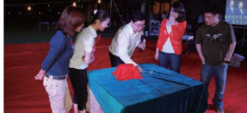
严谨人力经理还是魔术高手 众人监督仍难辨奥秘