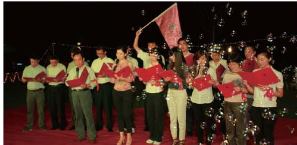
探求队朗诵诗歌《东方》