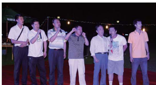
部队转业的公司员工合唱《咱当兵的人》

春夏交替，岁月更迭。在火红的七月我们典藏半年工作，欢庆取得的成绩、总结收获的经验，为齐心协力、圆满完成全年工作各项任务鼓劲加油。