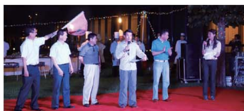
老师公布拓展活动得分 各队队长为队员鼓劲加油