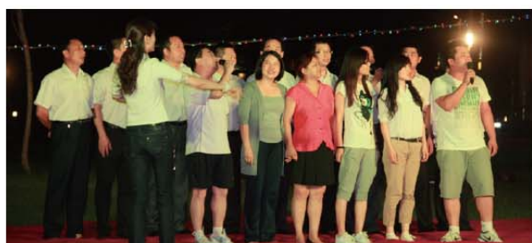
超越队合唱《没有共产党就没有新中国》