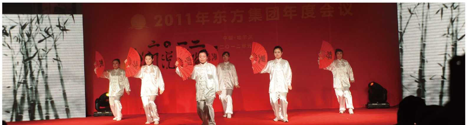
物业公司 - 舞动东方

东方大厦物业公司的太极扇《舞动东方》，展现了这些平时默默服务的大厦保洁员和食堂工作人员绚丽的风采。扇面上“东方明天更好”寄予了舞者对东方集团真挚的祝福。