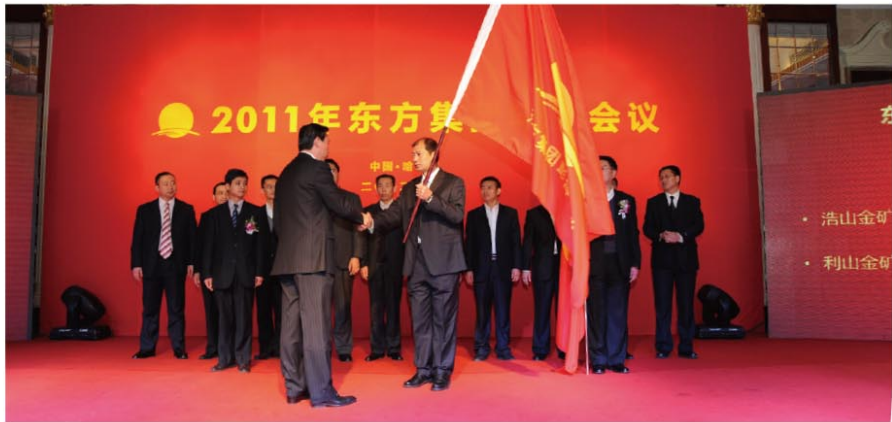
东方集团董事局主席向矿业团队授旗