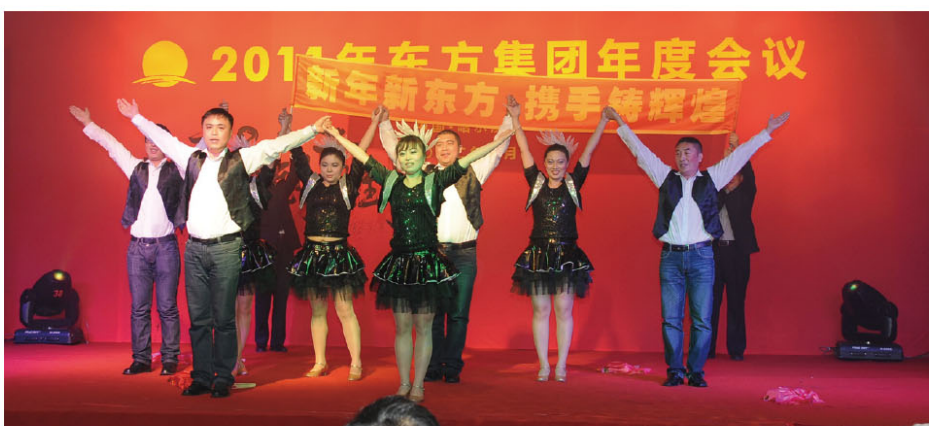
财务公司 - 绮丽华彩

我们的身心融化在来自东方的碧波里，是一种无畏探求的冲动在随波激荡——集团北京总部员工诗朗诵《东方之魂》，讲述东方 33 年的激情岁月。