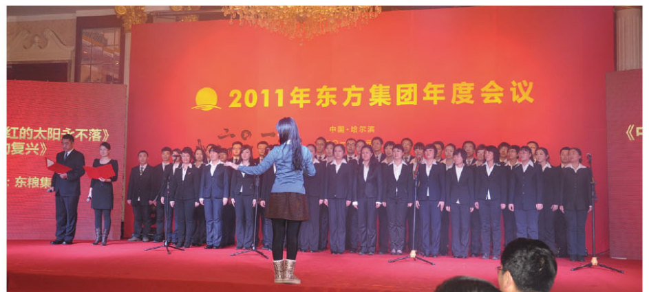
东粮集团 - 大合唱

财务公司计划财务部、综合事务部等部门的舞台剧《绮丽·华彩》，穿插爵士舞、古典舞等多种形式，舞蹈绚丽多姿。