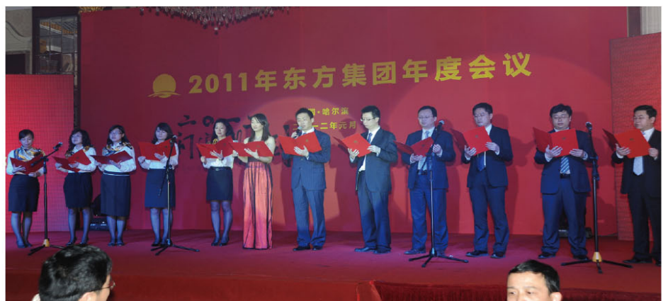
北京总部 - 东方之魂

东粮集团员工的集体舞《炫彩民族风》，融合藏、维、蒙族等多民族的舞蹈元素，展现了东方集团汇集不同民族、不同国籍的大家庭特色。