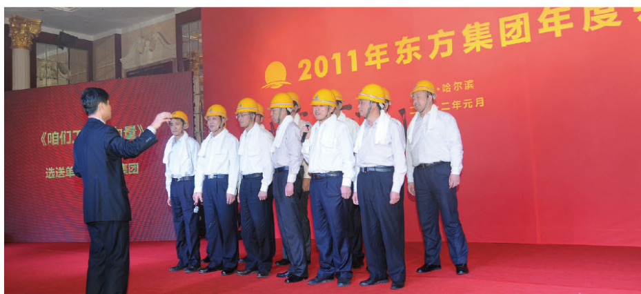
东方矿业集团—咱们矿工有力量